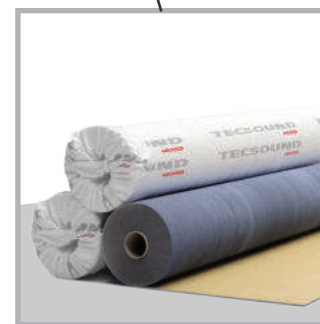
Укладываем слой звукоизоляционной мембраны.